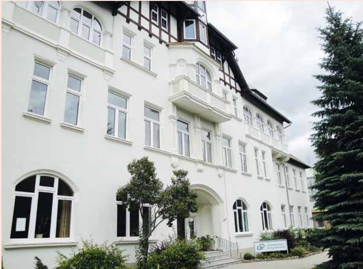
Feierte am 10.07. ihr 5-jähriges Jubiläum: Die Freie Gesamtschule im Gartenreich in Oranienbaum