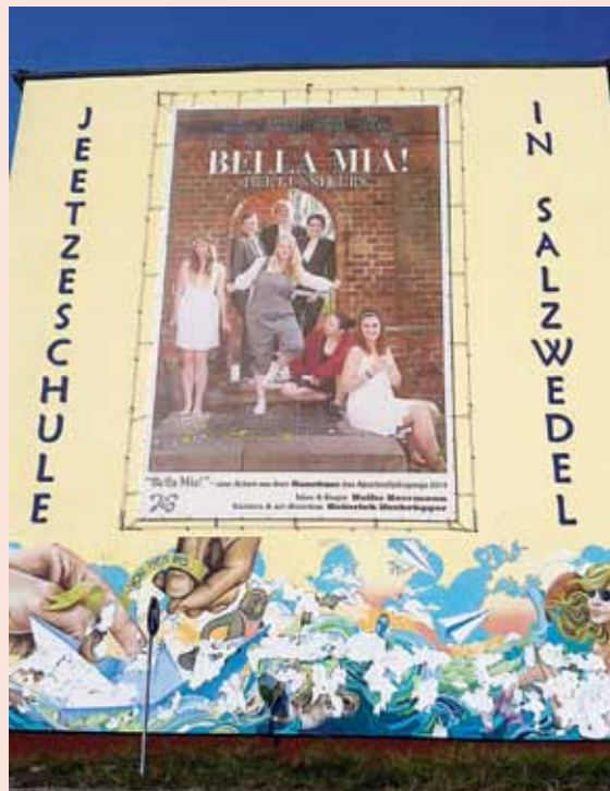
Seitenansicht der Jeetzeschule Salzwedel mit einem überdimensionalen Schülerplakat