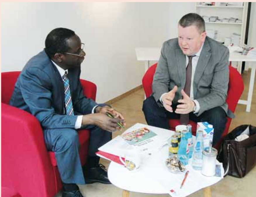
Intensives Gespräch mit Dr. Karamba Diaby über verschiedene bildungs- und arbeitsmarktpolitische Fragen in dessen Abgeordnetenbüro in Halle/Saale