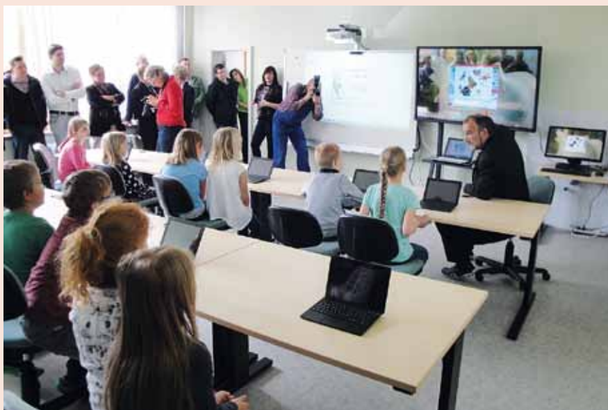
Am 28.05. nahm die Freie Landschule Osterhausen (bei Eisleben) zur Freude ihrer Schüler|innen ein modernes Computerkabinett in Betrieb.